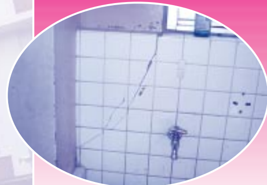
タイルにひび割れが入った校舎