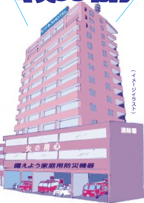
(イメージイラスト)