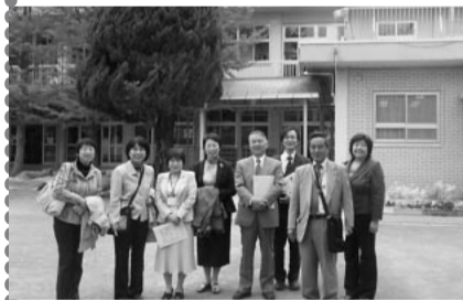
園庭も広い江戸川区立幼稚園を見学し、幼児教育支援策について視察する共産党市議団

江戸川区では園児1人あたり月2万6千円（上限）まで補助しており、月5千円程度で私立幼稚園に通わせることができます。保育料が月額3千円の区立幼稚園との公平性、「格差是正」を目的に補助が手厚くされてきました。