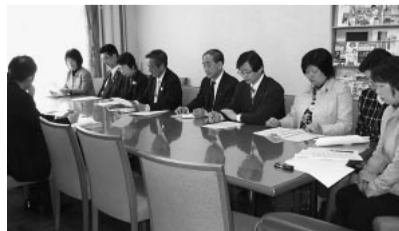
市長あてにアンケート結果と要望書を提出する共産党市議団

奈川労働局に、アンケート結果と要望書を提出。市民の雇用と、健康、生活を守る緊急対策を申し入れられました。