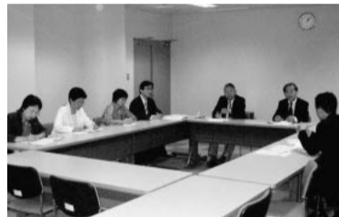
大田区役所で中小企業支援策について聞き取りする共産党市議団

事業所の9割以上が従業員19人以下の川崎市では、小規模事業所への融資の拡充が求められています。