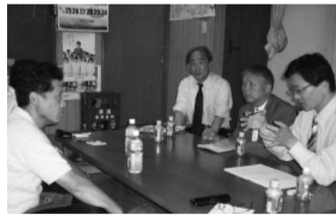
登戸東通り商店街で、多摩区商連の子育て支援カード、プレミアム付き商品券のとりくみや要望を聞く共産党市議団

10%、20%のプレミアム付き商品券を販売し、売り上げが伸びている多摩区商連のとりくみが好評です。神戸市では、商品券のプレミアム分の半分と、印刷・広報にかかる事務経費を市が補助しています。