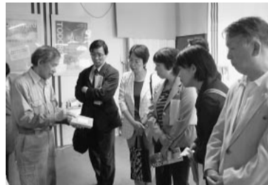
等々力工業会の展示場を視察する共産党市議団

共産党市議団は、町工場36社の技術が集積し、製品・アイデア作品を展示している中原区の等々力工業会の展示場を視察。6月議会で、常設展示が継続できるように家賃補助や、優れた製品・技術のPR、販売・普及、他企業とのマッチングなどを市が支援するよう求めました。